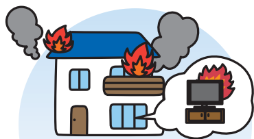
テレビが発火して家屋が焼失

貴社が製造・販売した財物(生産物)が他人に引き渡された後、その生産物の欠陥により発生した偶然な事故