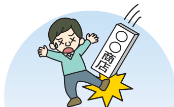
取り付けた看板がはずれ、通行人に当たりケガをさせてしまった。